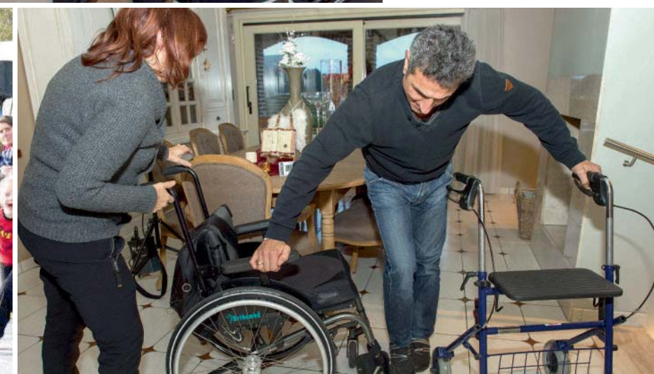
Zonder hulp raakt hij niet in zijn rolstoel.