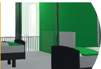
Groepskamer (tweepersoonskamers schakelbaar tot 8p)