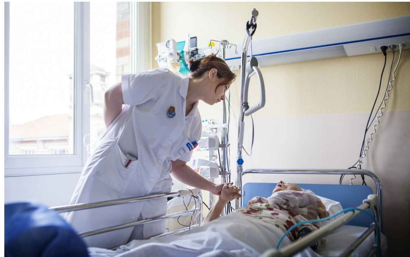
Palliatie is niet de aanloop naar de dood, al is het ooit wel zo begonnen.

Palliatieve zorgen moeten vroeger beginnen, en niet alleen de allerlaatste dagen van iemands leven worden opgestart, zegt de wetenschap. Groen eist een ander beleid.