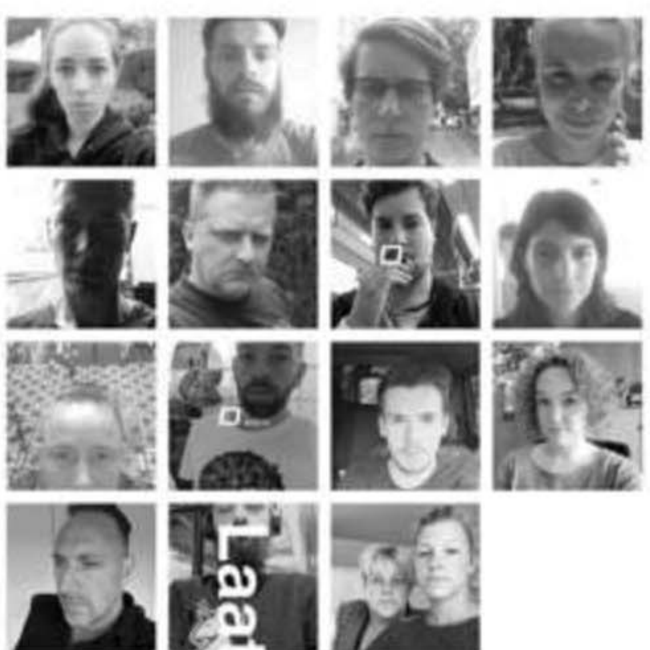
Bekend Snapchat hulde zich vandaag in stilte.

Geen actie, geen geluid, enkel de stilte heerste in hun korte filmpjes.